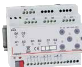
0 026 73