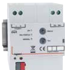
0 026 65